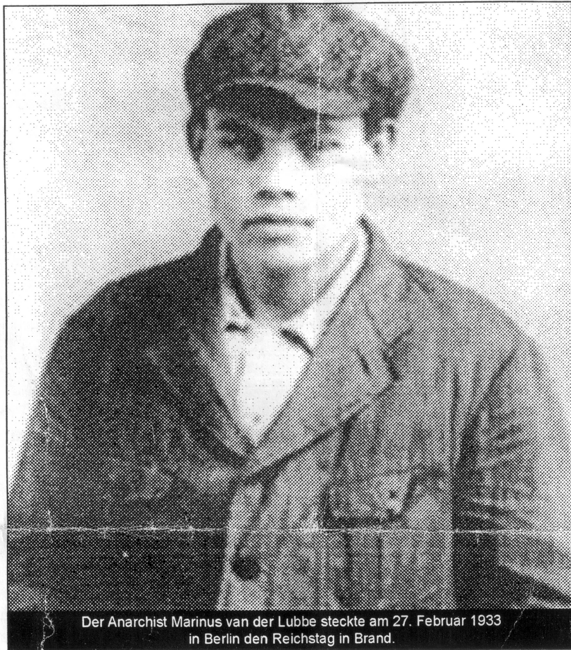
Der Anarchist Marinus van der Lubbe steckte am 27. Februar 1933 in Berlin den Reichstag in Brand.

Bürger! Die Wahlen rücken näher. Wisst ihr schon wen wählen?