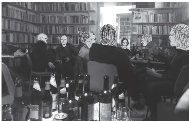
Typische linke Kneipenszene während des Ausnahmezustands 2020ff

Die Kneipe ist für sie ein besonderer sozialer Ort. Wie kein anderer bietet sie jedem die Chance, unumwunden und Übergangslos mit jedem (und natürlich auch jeder) ein Gespräch zu beginnen. Wer in die Kneipe geht, will sich unterhalten oder unterhalten lassen. Die Schwelle der Ansprechbarkeit liegt in ihr niedriger als außerhalb. Dort ist zumeist ein Dritter nötig, über den eine gewisse Verbindlichkeit der gegenseitigen Anrede sich herstellen muß, damit ein Gespräch entsteht. In der Kneipe dagegen genügt bereits das Miteinander in dem einen Raum, um eine Unterhaltung mit Fremden zu beginnen.