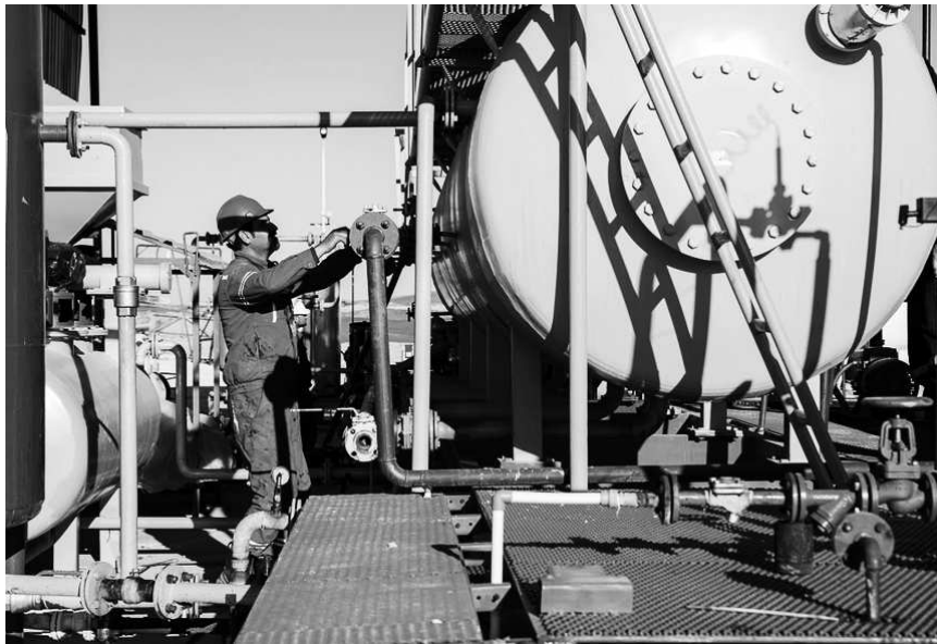
Raffinerie bei Dêrika

wirtschaftlichen und sozialen Leben sowie in der Erziehung schlechter sein würden, als die der Syrier. Der Hauptpunkt der „Grüner Gürtel“-Politik war es, das kurdische Land zu konfiszieren und Araber aus verschiedenen Gebieten dazu zu bringen, auf kurdischem Gebiet zu siedeln, welches dann unter diesen verteilt wurde. Kurz gesagt kamen die kurdischen Bürger unter Assad an dritter Stelle, nach den Arabern und Christen.