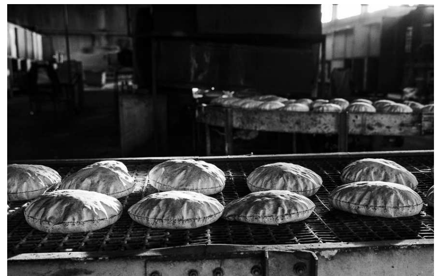
Bäckerei in Qamishli

Was die Telefonkommunikation angeht, ist es so, dass alle Mobiltelefone entweder im Netz der KRG oder der Türkei nutzen, je nachdem wo man sich befindet. Das Festnetz ist unter der Kontrolle der Tev-Dem & der DSV und scheint gut zu funktionieren. Auch dieses ist kostenlos!