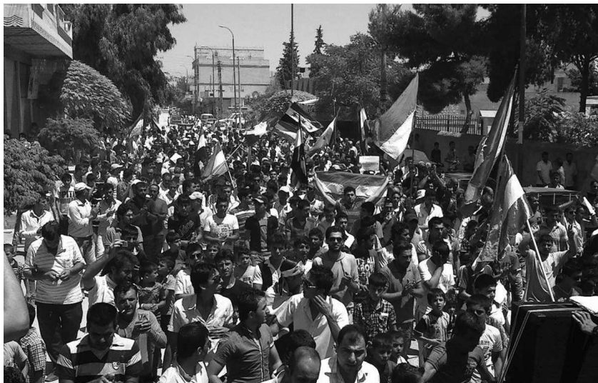
Kurdische Demonstration in Kobanê, 20. Juli 2012.